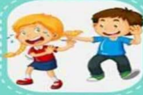
شد الملابس أو الشعر

وشتمه. ويمكن إن يكون التنمر على العديد من الأشكال فيمكن إن يكون على شكل تهديد أو تخويف الشخص، بالإضافة إلى إن التنمر يمكن ممارستها في أكثر من مكان وبالأخص المدرسة. المحتويات عرض مقدمة بحث عن التنمر المدرسي يختلف التنمر إذا كان من قبل شخص واحد أو مجموعة من الأشخاص، ولكن لا شك أن لكلا النوعين العديد من الآثار السلبية التي تظهر على الشخص. والتي من الممكن أن يصل إلى تحويل سلوك الفرد من شخص طبيعي إلى شخص ذو انحراف سلوكي للدفاع عن ما يبدر من الآخرين من تنمر. شاهد أيضًا: آثار تفكك الأسرة على الأطفال ينقسم التنمر إلى العديد من الأنواع التنمر اللفظي: فهو يعني قول ألفاظ تكون بها إهانة للشخص أو سبه وشتمه. وأيضًا يقوم بالسخرية منه بالألفاظ كما انه يقوم بمناداته باسم ما يسيء له ولا يحب أن ينادي به. التنمر الجسدي: فهو يكون على شكل الأذية بالضرب. ودفع جسمه بقوة مما يجعله يهان وأيضًا الأذى بالجسم مثل الجروح