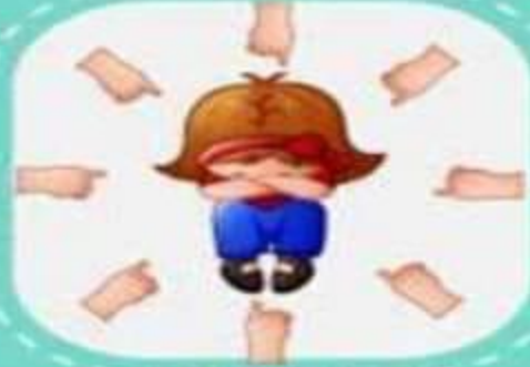
السخرية و إطلاق أسماء مثيرة للضحك