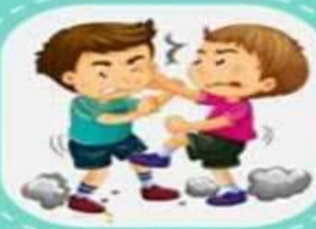
الضرب والركل أو اللكم