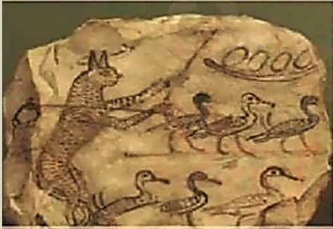
قط واقف على قدميه الخلفيتين وهو يقود مجموعة من الأوز