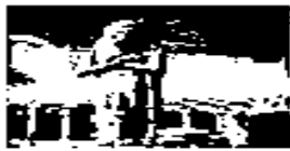
حضارة مصر الفرعونية