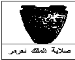
صلابة الملك نعرمر