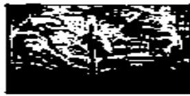
حضارة بلاد العراق

٦) "منح الله سبحانه وتعالى المنطقة العربية العديد من المقومات التي أسهمت في قيام حضارات مزدهرة رائدة بين حضارات العالم القديم".