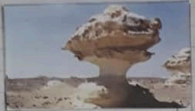
محمية الصحراء البيضاء بالوادي الجديد

٣- لو كنت مسئولاً عن أحد الأماكن التي تقدم خدمات سياحية: