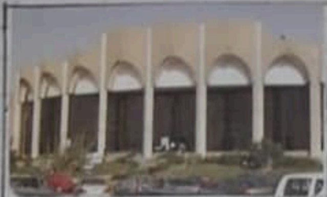
المركز الدولي للمؤتمرات بالقاهرة