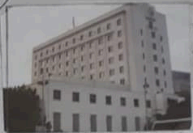
مقر جامعة الدول العربية بالقاهرة

مثل واجهة سيوة بالصعيد الفريقي وجبال البحر الأحمر ومدينة رأس محمد بجنوب سيناء ، والمناطق الزراعية تتميز بوجود نهر النيل والحقول الخضراء ، والسواطي الرملية الجميلة كما في سواحل البحر المتوسط ، وانتشار السحاب المرحلية الخلابة والأسماء ذات الألوان الرائعة بالبحر الأحمر . - مقومات بشرية : وتشمل : ( تنوع الآثار التاريخية - الأمن والأمان - وسائل النقل والاتصالات - وفرة المنشآت السياحية - عادات وتقاليد الشعب المصري ) . تمتلك مصر الكثير من الآثار المتنوعة مثل : ( الآثار الفرعونية - و الآثار اليونانية والرومانية - الآثار القبطية - الآثار الإسلامية ) و أدى ذلك إلى ازدهار السياحة التاريخية . ونجد في مصر الأمن والأمان فيسهر السائح بالأمم على نفسه وماله ، ويتوافر في مصر العديد من وسائل المواصلات والاتصالات فيجعل السائح بسهولة إلى المناطق السياحية وتيسر له الاتصال بولمته وأهله . كما يتوافر في مصر كثيرًا من المنشآت السياحية مثل الفنادق والقرى السياحية من أجل توفير وسائل الراحة والترفيه للسائحين . واعتاد المصريون منذ وقت طويل على وجود السائحين بينهم واعتادوا على الترحيب بهم وتقديم كل سبل الراحة والمساعدة لهم مما أدى إلى جذب السياح إلى مصر .